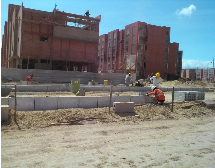
Parques de Villa Javier —Bosa

El análisis del mercado laboral permite conocer el comportamiento de la oferta y demanda de trabajo en una zona determinada. Así mismo, el crecimiento en la actividad productiva de un país o región, guarda una estrecha relación con los niveles de ocupación del mismo. De tal forma, que a mayor crecimiento económico se espera una menor tasa de desempleo. Por esto, el empleo se constituye en uno de los indicadores de referencia, para el análisis económico y social, en el marco de las políticas públicas.