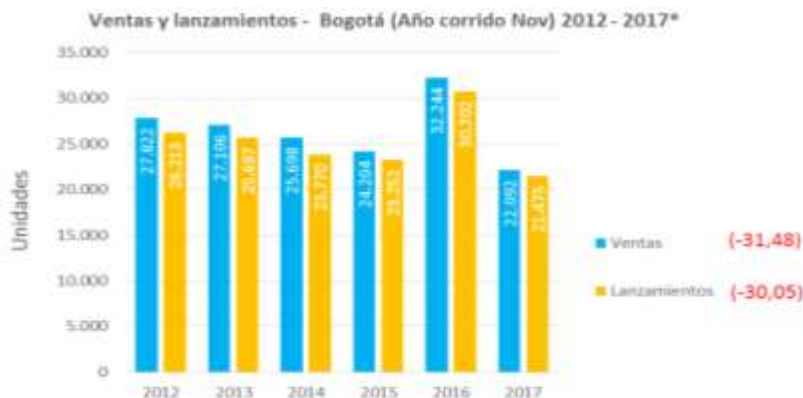
Fuente: Subdirección de Información Sectorial. Datos: La Galería Inmobiliaria

En contexto con el ambiente macroeconómico en lo corrido del año hasta octubre de 2017, los lanzamientos de vivienda fueron de 21.475 unidades, lo cual representa una disminución del 30,1% si se compara con el mismo periodo de 2016 (30.072) y del 17,2% frente al promedio de los últimos 5 años (25.927). Este resultado obedece a la disminución en el lanzamiento de vivienda VIS, el cual registró un total de 9.099 unidades, presentando una variación negativa del 46,6% en comparación con el mismo periodo del año anterior (17.049) y de 25,8% frente al promedio de los últimos 5 años (12.257).